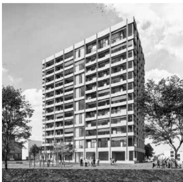
Papieri-Areal, Hochhaus L, Cham 12-geschossiges Wohn-Hochhaus mit Gewerbe im EG und einer 3- geschossigen Tiefgarage Planung von HLKS + RDA-/ MRWA Anlagen