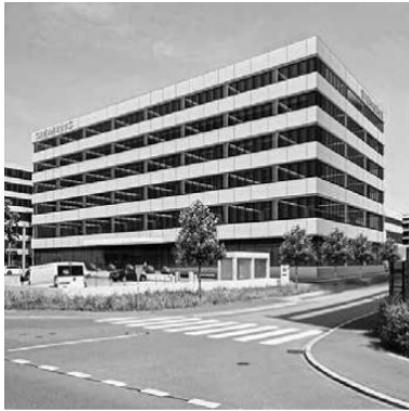
Siemens TH1c, 6300 Zug Gebäude-Gesamtsanierung inkl. den kompletten HLKS-Anlagen in der BIM Methode für ca. 20 000 m 2 Büro- und Labornutzung