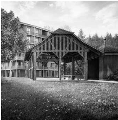
MFH Francesco, Kloster Wesemlin, Luzern Neubau mit 30 Wohnungen, Dienstleistungs- und Praxisräume im Erdgeschoss Planung von HLS Anlagen + Fachkoordination