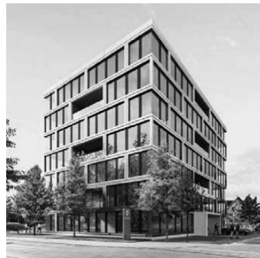
Bürohaus Alpha, 6340 Baar Neubau Geschäftshaus mit ca. 4700 m 2 Bürofläche. Planung HLS Anlagen + Fachkoordination für den Grundausbau und div. Mieterausbauten