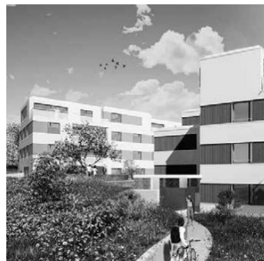
3 MFH Bifang, Hausen am Albis Neubau von 3 MFH mit Anbindung an den Fernwärmeverbund der Albisbrun- Stiftung Planung von HLS Anlagen + Fachkoordination